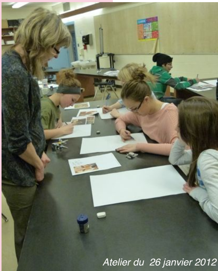
Atelier du 26 janvier 2012

Finalement, les élèves iront aussi faire un atelier directement à la galerie, en compagnie des élèves de l'école de Kahkewistahaw.